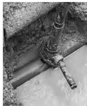
Defekter Hausanschluss, hier läuft das Wasser aus der maroden Leitung ins Erdreich