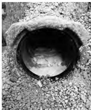
Kalkablagerungen in der Wasserleitung Bereich Sendling

Wir werden Sie über die Ergebnisse der Gefährdungsbeurteilung natürlich ausführlich informieren und in Zusammenarbeit mit dem Ingenieurbüro, eine „Marschroute“ in Richtung einer effizienten, langlebigen und zukunftsicheren Trinkwasserversorgung präsentieren.